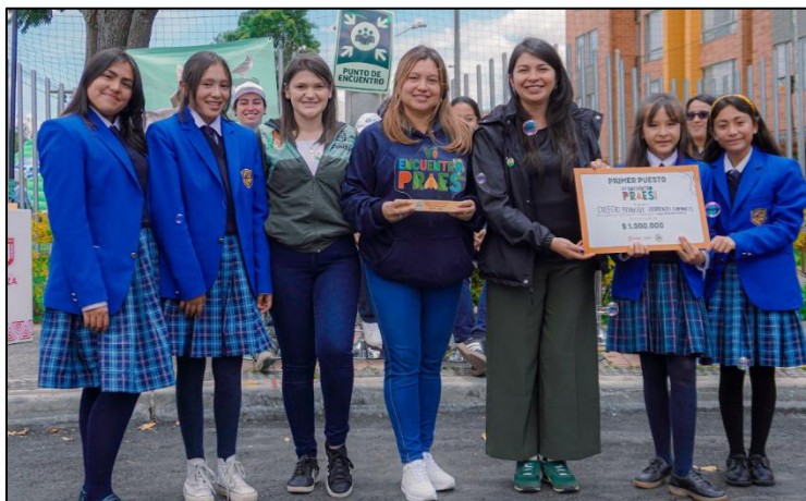
Ilustración 7. Primer puesto categoría seguridad alimentaria

Primer puesto: Colegio Bilingüe Abriendo Caminos – Un millón de pesos ($1.000.000)