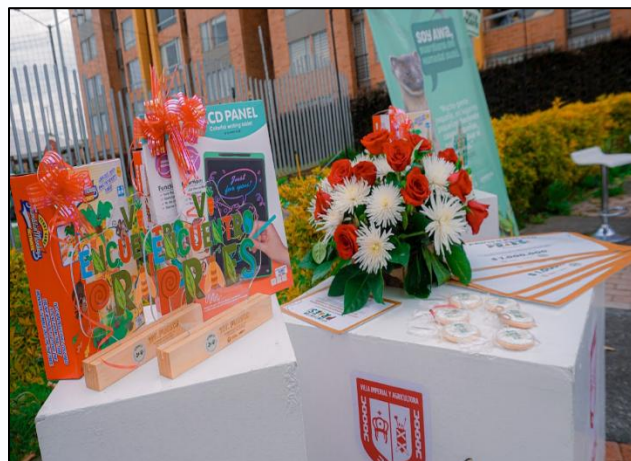
Ilustración 1. VI Encuentro PRAES

Durante la jornada, los estudiantes y docentes presentaron los proyectos ambientales escolares postulados en el marco de la convocatoria de la Resolución No. 660 del 22 de agosto de 2025 ante el jurado calificador y el público asistente, evidenciando procesos de investigación, trabajo en equipo y apropiación del territorio. Las exposiciones se desarrollaron mediante la presentación de stands, maquetas, productos elaborados y demostraciones prácticas que reflejaron el impacto de los PRAES en la transformación ambiental de las instituciones y comunidades.