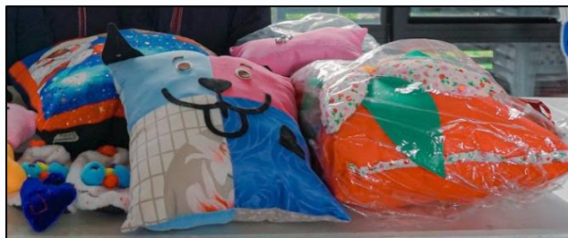
Ilustración 3. Elementos proyectos postulados

El encuentro contó con la participación activa de la Gobernación de Cundinamarca, a través de la feria ambiental, la cual ofreció espacios pedagógicos, actividades lúdicas y exhibiciones como show de títeres, que fortalecieron la comprensión de temas como el manejo adecuado de residuos, biodiversidad, cambio climático y conservación del ambiente.