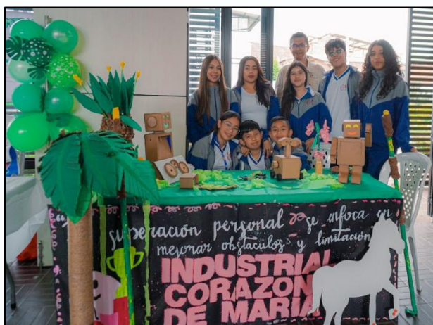
Ilustración 2. Stands proyectos postulados