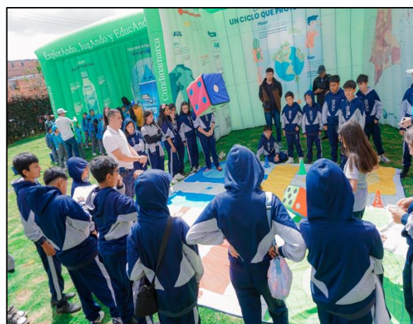
Ilustración 4. Feria ambiental