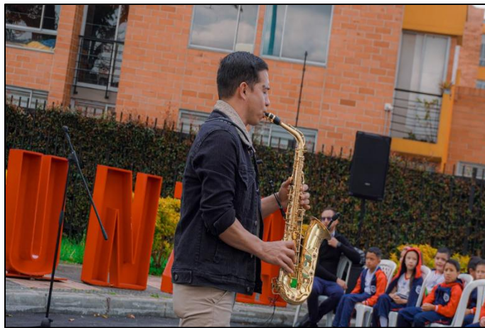
Ilustración 6. Actos culturales

La jornada concluyó con la ceremonia de premiación, en la cual se reconocieron los proyectos más destacados en cada categoría. Este acto simbólico representó no solo la entrega de incentivos económicos, sino también el reconocimiento al esfuerzo, la creatividad y el compromiso ambiental de las instituciones educativas del municipio.