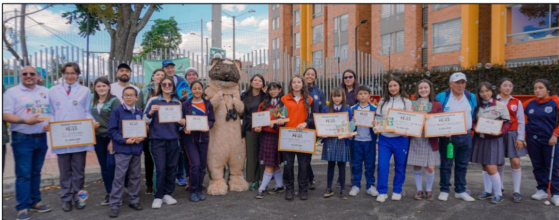
Ilustración 12. Certificados de participación

Finalmente, se llevó a cabo la entrega de certificados de participación a todas las instituciones educativas postuladas, como reconocimiento a su compromiso, dedicación y aporte a la educación ambiental en el municipio. Este gesto reafirmó la importancia de la participación continua y el trabajo colaborativo entre las comunidades educativas en la construcción de un territorio más sostenible.