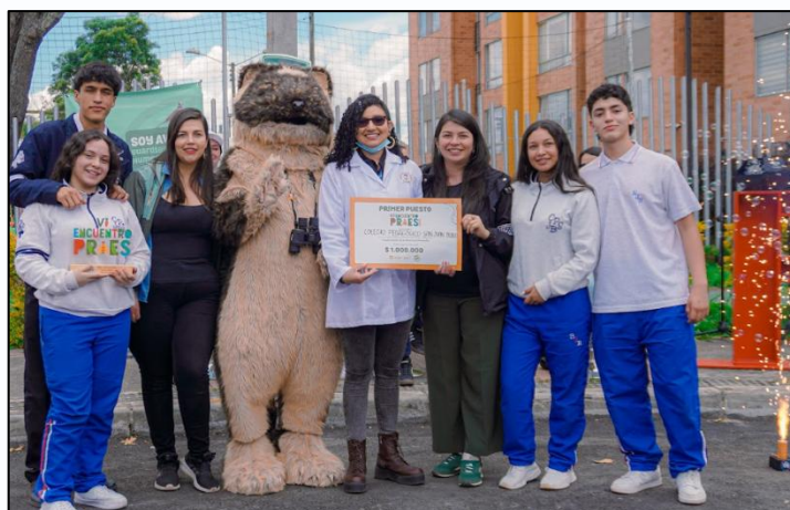
Ilustración 11. Primer puesto categoría conservación de los recursos naturales

Primer puesto: Colegio Pedagógico San Juan Bosco – Un millón de pesos ($1.000.000)