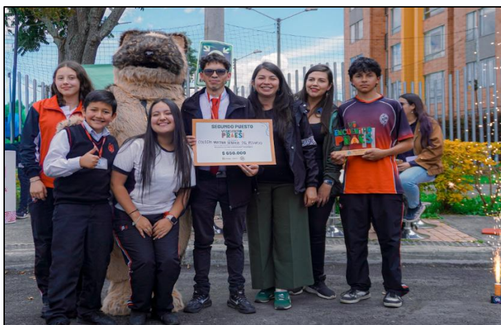
Ilustración 10. Segundo puesto categoría economía circular e innovación tecnológica

Segundo puesto: Colegio Nuestra Señora del Rosario Funza – Seiscientos cincuenta mil pesos ($650.000)