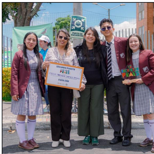
Ilustración 8. Segundo puesto categoría seguridad alimentaria

Segundo puesto: Colegio Parroquial Santiago Apóstol de Funza – Seiscientos cincuenta mil pesos ($650.000)