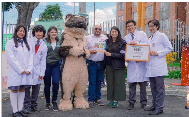
Ilustración 9. Primer puesto categoría economía circular e innovación tecnológica

Primer puesto: Institución Educativa Técnica Bicentenario – Un millón de pesos ($1.000.000)